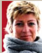
Catering, Turnierbüro Britta Pressler