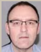
Technik Klaus Balleis