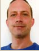
Technik, Video Florian Zeibig